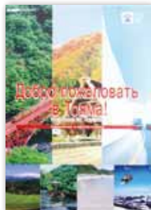
富山県様 ロシア語観光パンフレット

英語・韓国語・中国語(繁体・簡体)・ロシア語対応のパンフ レット等を作成いたします。