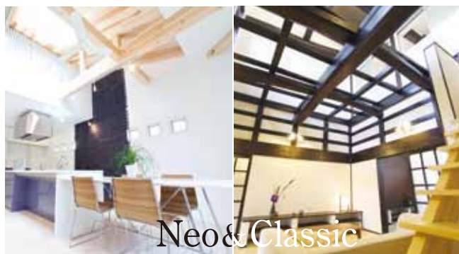
新築住宅と再生住宅の施工例

弊社から提案したロゴタイプ。これからのライフスタイルを白で、伝統を受け継ぐライフスタイルを黒で表現。いいものは残しながらも新しいライフスタイルに合った家づくりをネーミングに込めました。