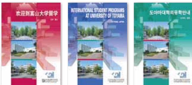
富山大学様 留学生ガイドブック

弊社では、英語・韓国語・中国語(繁体・簡体)・ロシア語 の実績があります。日本語でデザインしたものを翻訳から 最終ネイティブチェックまでの業務を一緒に行います ので安心してお任せいただけます。